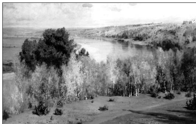
В.Д. Поленов. «Золотая осень». (1893)

(«Осень! Обсыпается весь наш бедный сад...», А. К. Толстой)