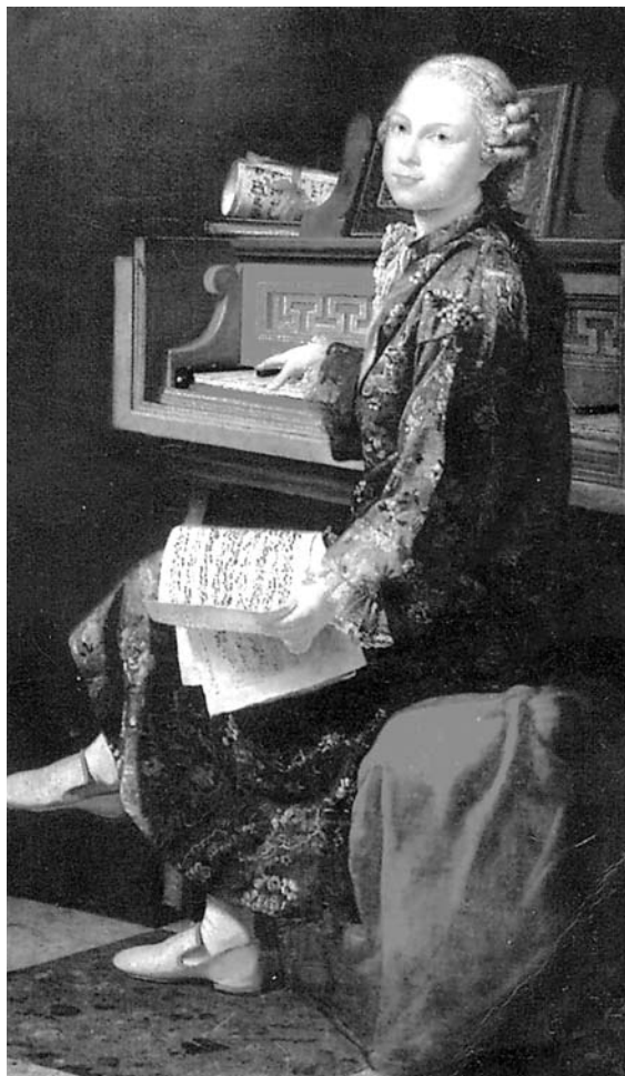
Маленький Вольфганг Амадей Моцарт

— Музыка, Ваше величество, — голос нашего сердца! — ответил с поклоном Вольфганг.