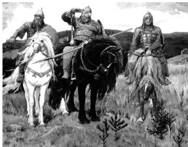
В.М. Васнецов. Три богатыря

«Не хочу с тобой сражаться. Я хочу с тобой побрататься».