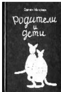
Матейчек Зденек. Родители и дети. — М.: Просвещение, 1992. — 320 с. с ил.

Как в голове ребенка устроен природный механизм восприятия книги? Как не разрушать, а, напротив, укреплять и развивать его? Изложу свое понимание этого вопроса. Первоначальное приобщение малыша к книге состоит из двух периодов — докнижного и книжного. «Воспитание словом — самое важное и самое трудное, что есть в педагогике». Вспомним эти слова В. Сухомлинского и порекомендуем родителям две современные книги, в которых это положение реализовано в методических решениях: