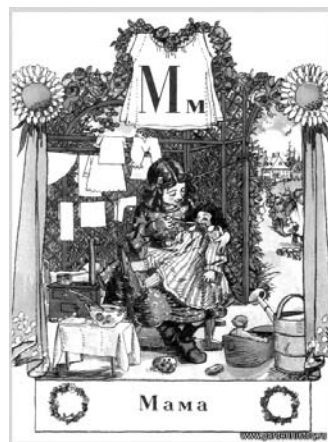
А. Бенуа. Азбука в картинах