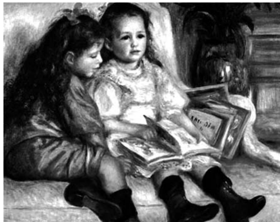
П.О. Ренуар. Жан и Женестьева Кайботт