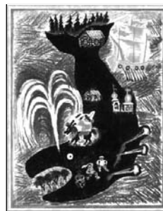
Радуга-дуга. Русские народные сказки, песенки, потешки / Рис. Ю. Васнецова (Любое издание).

Желательно, чтобы первыми картинками малышки были иллюстрации Ю.А. Васнецова (1900 — 1973) к русским народным песенкам и сказкам, несущие на себе отпечаток неповторимого, чудесного русского лубка — древнего искусства нашего народа — и проникнутые лирическим настроением, которое передается детям, возбуждая их фантазию: