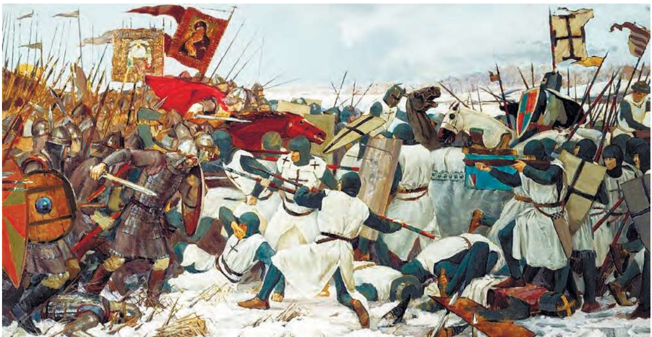
Худож. В.В. Маторин. Ледовое побоище. Слева – русское войско. Выделяется фигура князя в красном облачении. Над войском – знамёна-хоругви