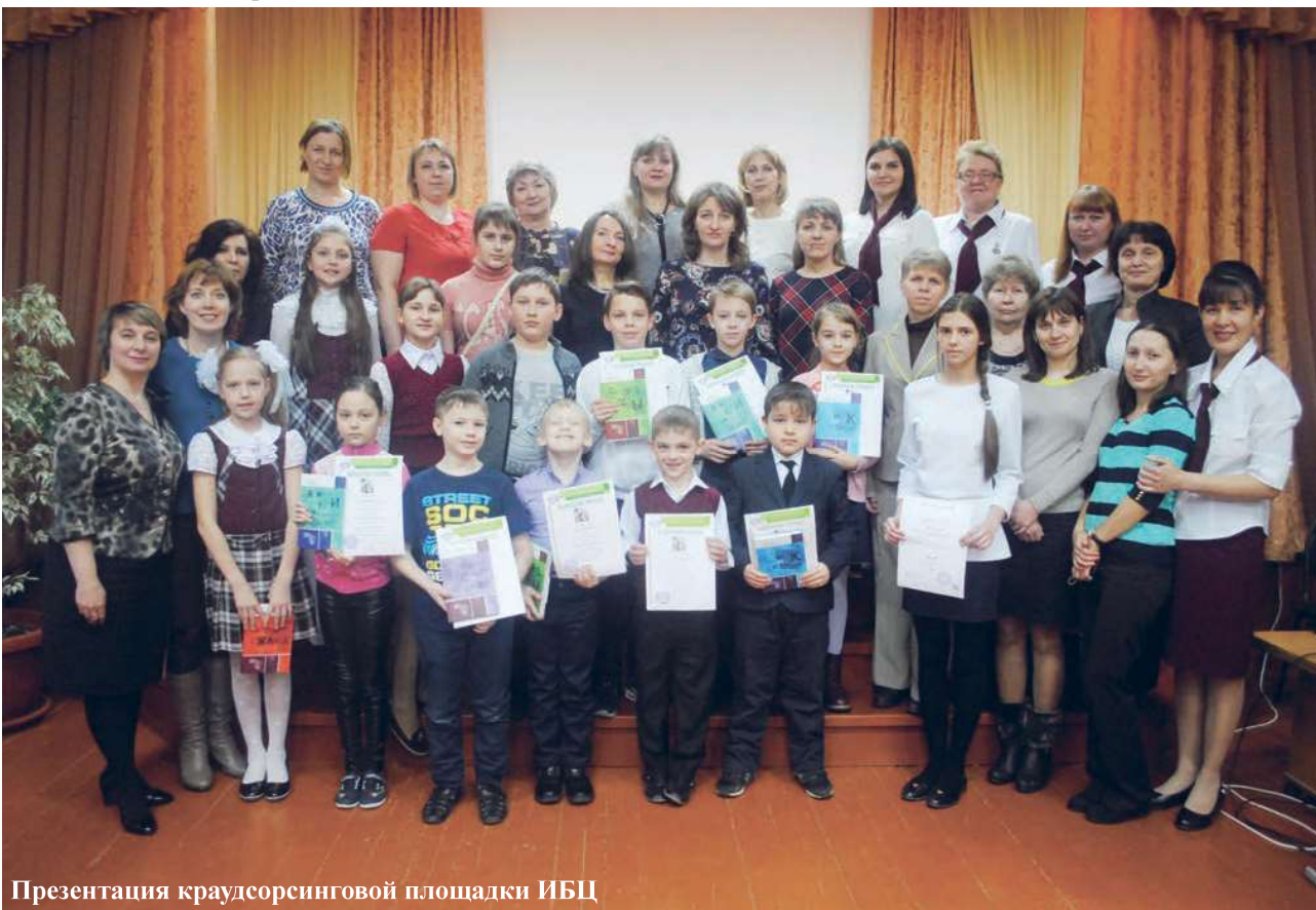
Презентация краудсорсинговой площадки ИБЦ

Наши социальные партнеры поддержали нас как в реализации, так и в дальнейшем развитии проекта. Так, межпоселенческой Центральной детской библиотекой был проведен литературно-исторический час «Жизнь как песня», посвященный Герою Советского Союза М. Джалилю. Центр семейного образования «Новый формат» неизменно участвовал во всех образовательных и досуговых семейных мероприятиях. Детская телестудия Новосергиевского ДДТ «Мы вместе»полнила школьный раздел своими видеофильмами