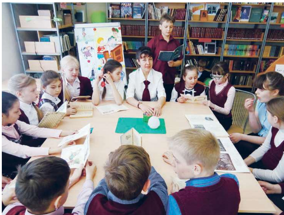
Творческий отчет юных читателей