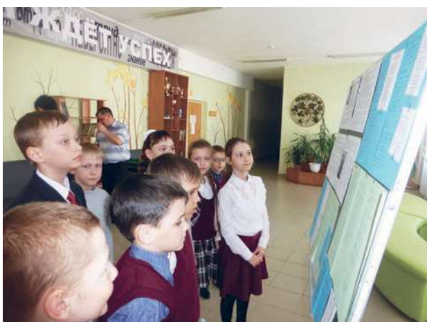
Читаем на перемене

Владимира Ивановича Даля, Сергея Тимофеевича Аксакова и Мусы Джалиля. Для учащихся, педагогов, родителей и жителей поселка мы проводили занятия образовательных курсов, открытые культурно-досуговые и образовательные события. К акциям «Цитобус. С.Т. Аксаков», «Цитобус. В.И. Даль», «Цитобус. М. Джалиль», «Вторая жизнь списанных книг», «Тетради Памяти» нам удалось привлечь не только родителей, но и взрослое население поселка. Ребята-волонтеры, проводившие