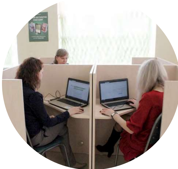
Зона для самостоятельной работы

Безусловно, важно показать возможности образовательного пространства современного информационно-библиотечного центра. Для этого мы создали модельную среду со всеми необходимыми пространственно-обособленными зонами разных типов: зону для самостоятельной работы на разных типах носителей, зону для групповой и проектной деятельности, презентационную зону, рекреационную зону (свободного чтения), закупили электронный контент. Занятия со слушателями КПК проводятся с использованием всех этих зон.