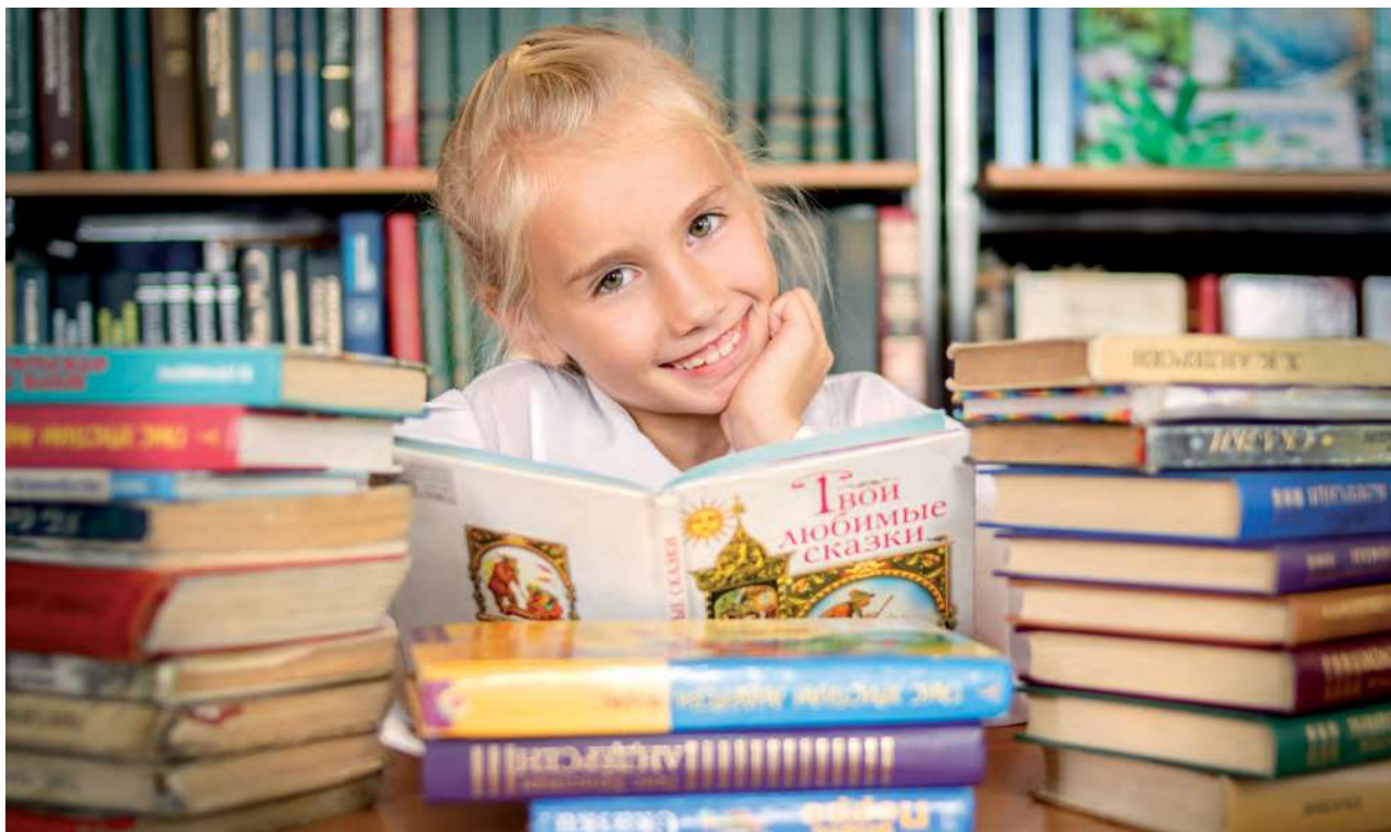
Фотоакция «Я читаю!»

Потребность в «горизонтальном» взаимодействии привела к появлению в Воронежской области профессионального сообщества педагогов-библиотекарей, которое осуществляет свою деятельность в разных направлениях. Благодаря деятельности сообщества были проведены различные мероприятия. В рамках Международного месячника школьных библиотек прошла фотоакция «Я читаю!», в которой приняли участие более 300 школьников. Цель акции – повышение интереса к чтению, популяризация деятельности школьных библиотек, вовлечение обучающихся в информационную и читательскую деятельность, создание привлекательного образа читающего человека. В ней могли принять участие учащиеся 1–11-х классов, для этого они должны были представить фотографии с изображением одного человека или группы людей с определенным сюжетом – чтение книг. Фотографии всех участников можно увидеть на образовательном портале