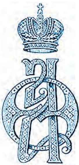
Экслибрис императрицы Александры Фёдоровны (1872–1918)