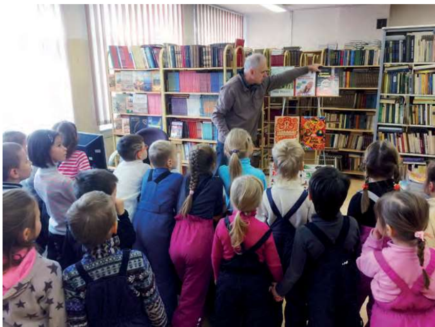
Дошкольники в библиотеке