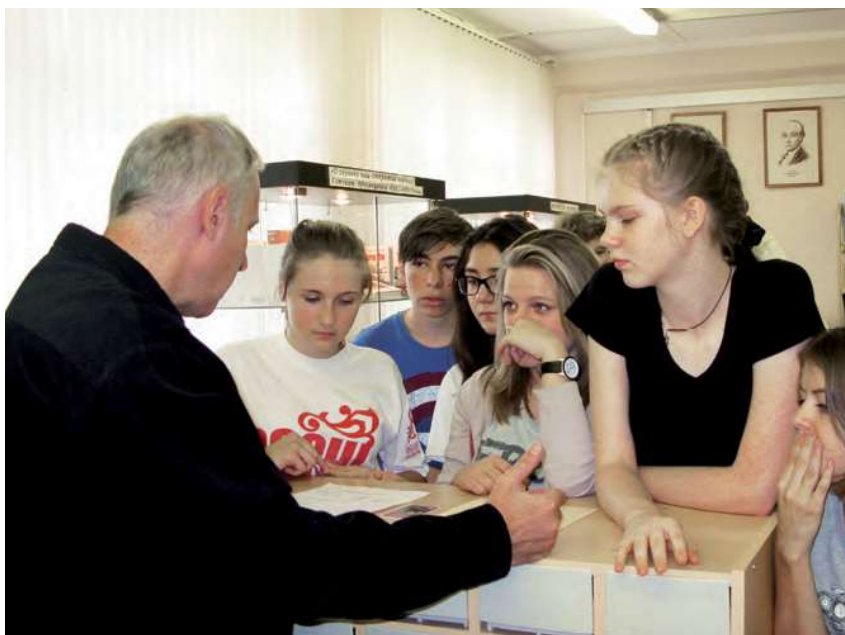
В библиотеке – старшеклассники

Но у бюрократии своя особенная логика, свои особенные, замкнутые на себя цели. И сила власти, с помощью которой навязываются обществу