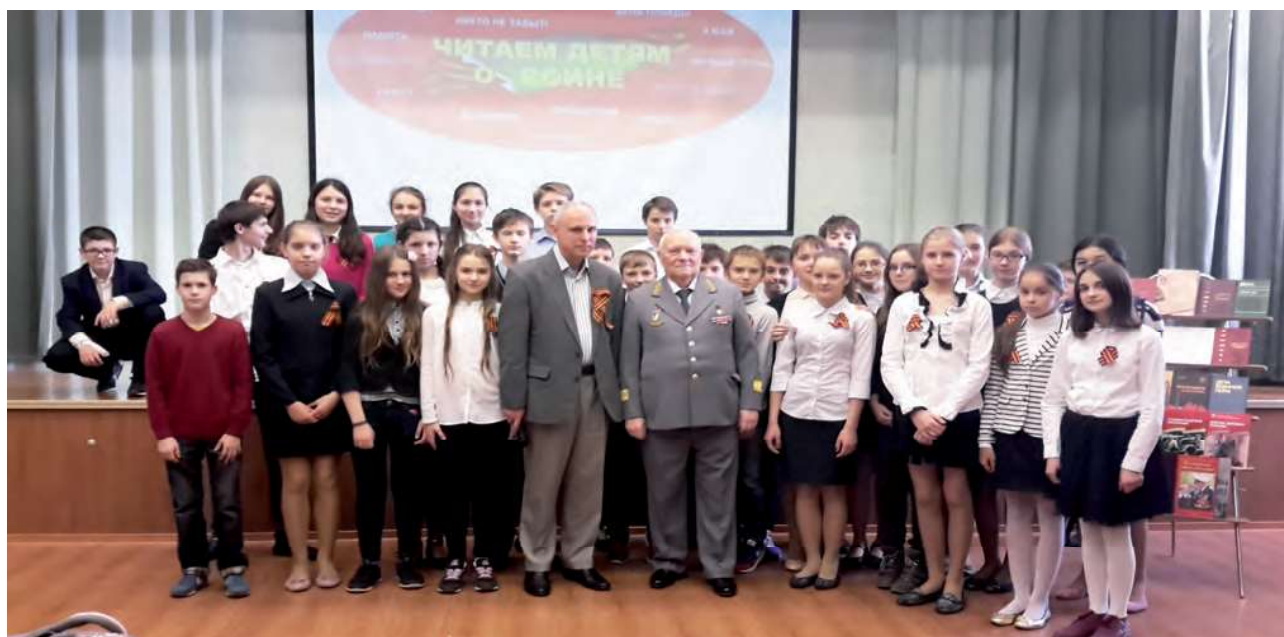
Акция «Читаем детям о войне»

Если нет критического отношения, осмысления, принятия гуманистических ценностей, определения приоритетов, то