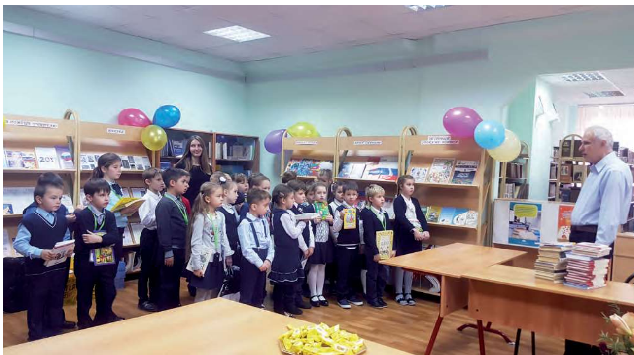
Акция дарения книг

Соотношение сознания и информации – одна из центральных социокультурных проблем. Поведение как