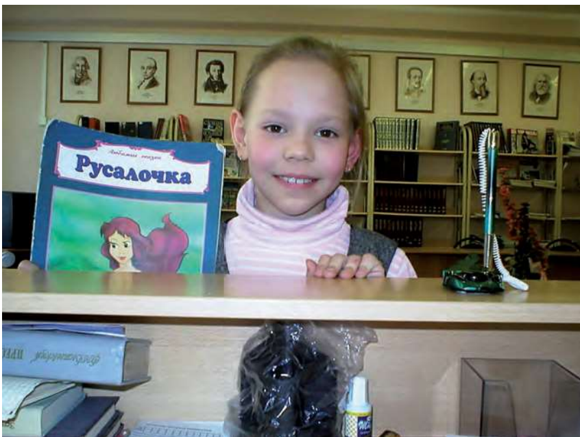
Первая книга из школьной библиотеки

просто враждебность: «Ну и что, что вы участвуете? Я тоже могу участвовать». Вот и весь разговор. Скажем прямо: школьную библиотеку душат те, кто определяет тактику в образовании и культуре. И этот тренд направлен в противоположную сторону тренду стратегическому. Тактика убивает стратегию. Кто победит – стратеги или тактики? Вот в чем вопрос! Какое будущее оставим мы своим потомкам – расчеловеченное технократическое или одухотворенное гуманистическое? И ответы на эти вопросы зависят от каждого,