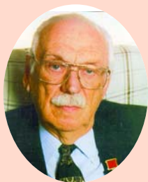
СЕРГЕЙ ВЛАДИМИРОВИЧ МИХАЛКОВ родился в 1913 году К 95-летию со дня рождения

Сергей Владимирович Михалков родился 12 марта 1913 года в Москве.