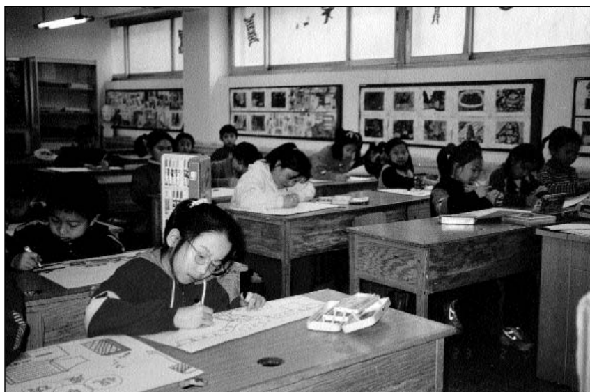
Библиотека при Пекинской опытной начальной школе № 2

ло в новую эру. В Пекине, Тяньцзине, Шанхае, Чунцине, Ланьчжоу, Шэньяне, Ханчжоу и других городах восстановили детские библиотеки. В мае 1981 года в Пекине Министерства культуры и просвещения, ЦК Коммунистического союза молодежи Китая провели совместный семинар по вопросам организации работы школьных, детских и юношеских библиотек. В нем приняли участие представители всех провинций Китая: сотрудники детских, юношеских, публичных библиотек, начальных и средних школ, юношеских клубов. Это был самый крупный после создания КНР семинар, посвященный работе библиотек, обслуживающих детей. С докладами и сообщениями на нем выступили известные специалисты в области образования, знаменитые детские писатели. Их слушали руководители страны. По итогам семинара был подготов-