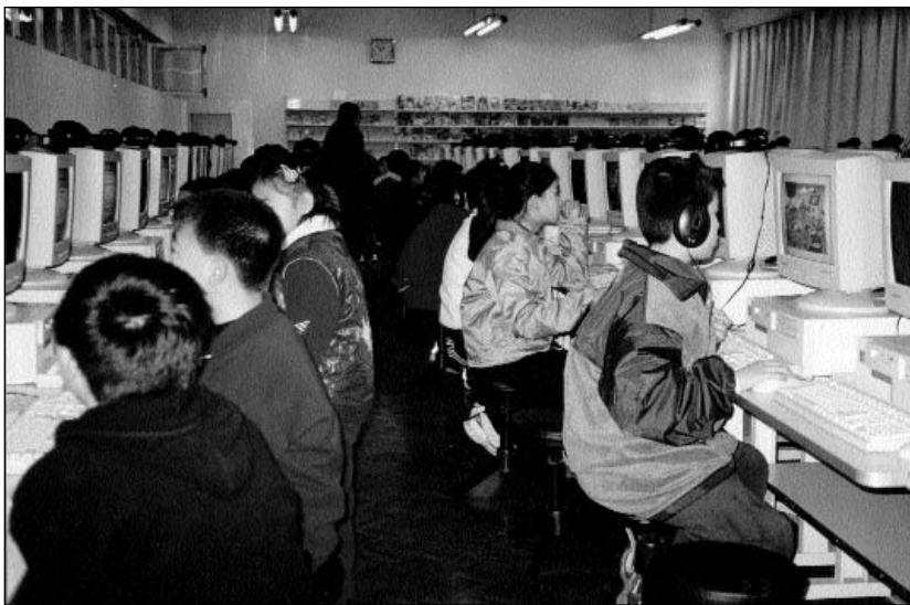
Электронный зал в библиотеке Пекинской школы № 2

По данным Министерства культуры страны в 1999 году в Китае функционировали 80 самостоятельных провинциальных или городских детских библиотек, 2201 читальный зал для детей при публичных библиотеках. По статистике Министерства просвещения в стране более 100 тыс. школьных библиотек. Кроме того, при комсомоле или при местных органах просвещения работает 500 Домов детей, большинство из которых открыли читальные залы.