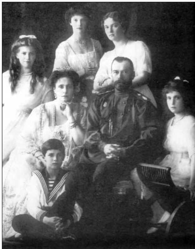
Император Николай II и императрица Александра Федоровна с детьми

тельных чувств по отношению к Николаю II и его супруге, — это была хорошая семья и ее уникальность еще больше оттенялась тем, что они стояли на высшей ступеньке общества.