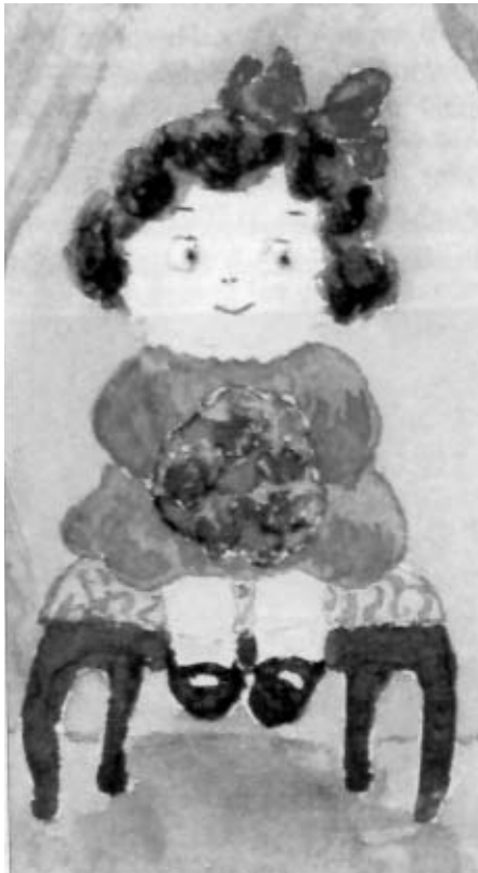
Рисунок великой княжны Анастасии, подаренный отцу

Совместное чтение царской четы во многом похоже на семейное чтение многих других русских семей того времени и все же имеет неуловимое отличие. Это не только чтение для отдыха, это напряженное духовное общение любящих друг друга мужа и жены, необходимое обоим. Несмотря на страшную занятость императора, чтения вдвоем откладывались только в самых экстренных случаях, книги для чтения проходили двойной отбор, сначала библиотекаря, затем самого Николая Александровича. Но