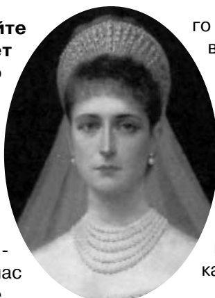
Императрица Александра Федоровна

Наше время не оставляет места для тайн. Открытие архивов, возвращенная литература, пересмотр взглядов на известные исторические события и конкретные личности, ежедневные газеты пестрят заголовками о разоблачении тайн, — словно покров за покровом снимается с истории, общественной и частной жизни. Но частности заслоняют то главное, ради чего и делаются все эти открытия. Главное остается скрытым, ибо таится не в сенсациях и выдающихся событиях, но в той ткани будничной и повседневной жизни, которая чаще всего остается скрытой от глаз исследователей.