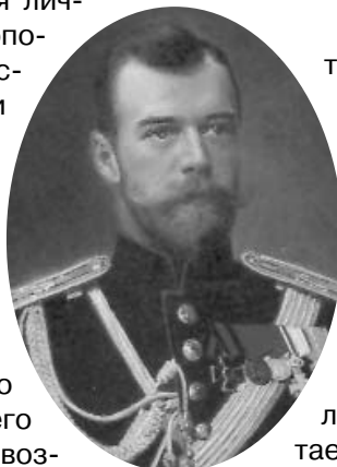
Император Николай II