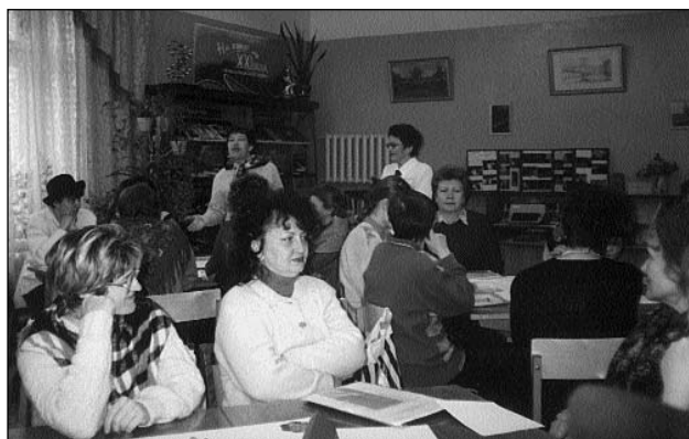
Участники семинара «Школьная библиотека на пороге XXI века»