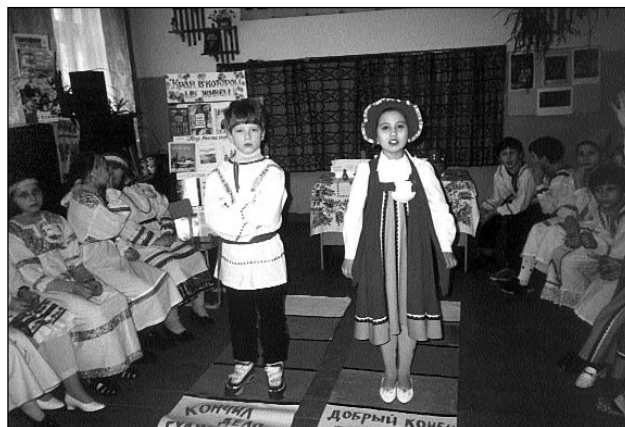
Читатели-дети частые участники библиотечных мероприятий

Правильно, по отраслям науки. Начиная с давних лет, люди свои накопленные знания старались как-то классифицировать. Путешество-