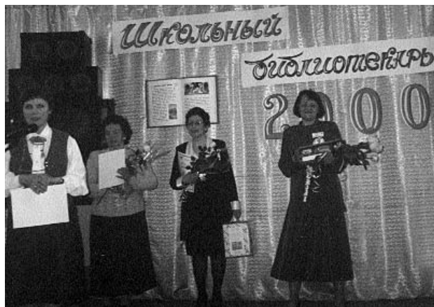
Конкурс «Школьный библиотекарь». Сергиев Посад

Царь: (читает указ): «Кто сумеет книги царские, коих набралось великое множество, так разложить, чтобы можно было нужную книгу