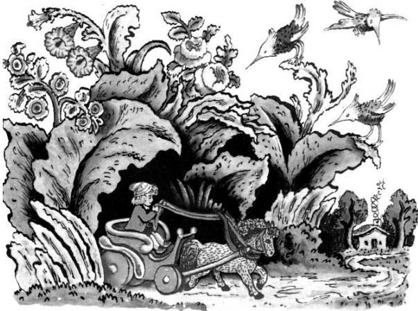
Художник В. КОНАШЕВИЧ