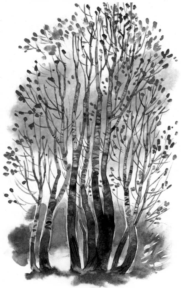
Художник Т. КАПУСТИНА

“В книге “Первое солнышко” художница изобразила березовую рощу весной. Вся иллюстрация словно пронизана ярким светом. Сочетание зеленого, голубого и белого создает ощущение праздника долгожданной весны. Художник Т.Капустина мне очень понравилась,