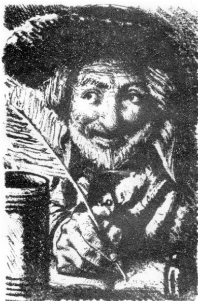
Кола Брюньон (Р. Роллан «Кола Брюньон»)

Сокровищница эталонов прекрасного в искусстве представлена в литературе и искусстве книжной графики. Искусство учит школьников видеть прекрасное в жизни. В подростковом возрасте активно идет формирование эстетических взглядов и суждений как осмысленных вы-