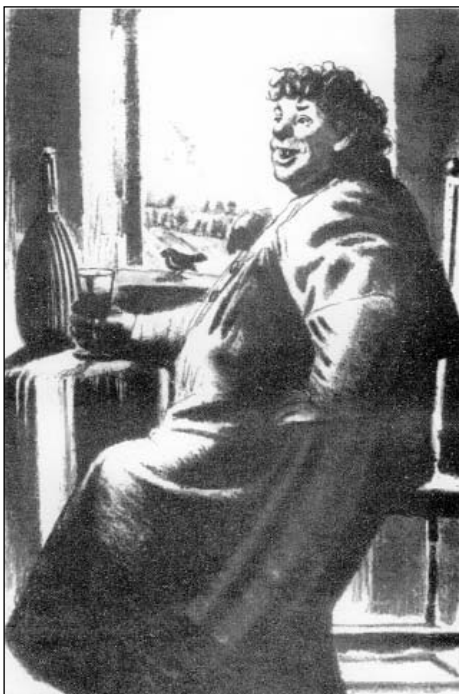
Шамай (Р. Роллан «Кола Брюньон»)

В иллюстрациях Е.Кибрика подростков привлекает сторона мировоззренческого начала, а также техника исполнения. Для подростка важны как сама иллюстрация, так и смысл, который в нее вкладывает художник-иллюстратор. Работа с иллюстрацией детской книги нацеливает на решение сложного комплекса образовательных и воспитательных задач. Среди них большое значение имеют задачи эстетического развития подростков. Активная воспитательная сила иллюстраций заключается в том, что она не оставляет равнодушным человека, затрагивает в нем сокровенные мысли, побуждает к духовным размышлениям, развивает в нем чувство красоты, способствует возникновению интереса к сюжету книги.