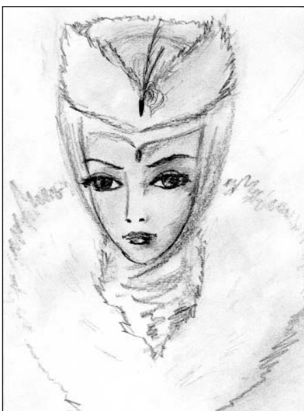
Портрет Марины (А.С. Пушкин «Борис Годунов»)

Учитывая психологические особенности возраста школьников 14-15 лет и влияние на их интерес к чтению, в экспериментальной работе было ис-