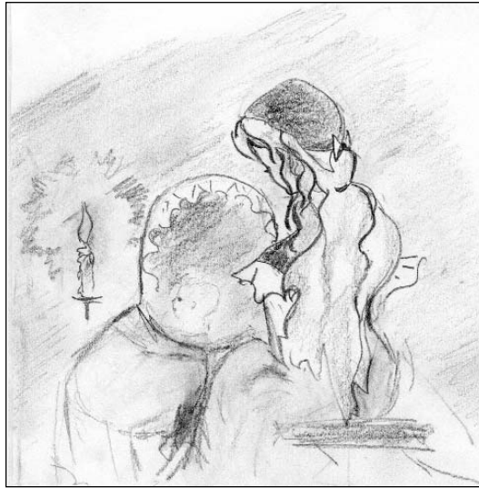
Рождение Тиль Уленшпигеля (Шарль де Костер «Тиль Уленшпигель»)

Одним из средств приобщения подростков к чтению является книжная выставка — распространенная форма библиотечной работы. Иллюстрация создает более полные возможности для восприятия образов, воспитывает эстетически, раскрывая мир большого искусства. Доступность иллюстрации — одно из важных качеств в условиях школьной и детской библиотеки. К иллюстрации можно неоднократно возвращаться для проведения бесед по эстетическому воспитанию подростков. Особенно это важно для сельских библиотек, удаленных от культурных центров. Творческий подход в работе с иллюстрацией в условиях библиотеки будет способствовать повышению культурного уровня подростков. На выставке, посвященной творчеству Е.Кибрика, были представлены следующие книги: