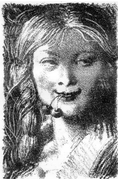
«Ласочка» (Р. Роллан «Кола

«Меня так поразила иллюстрация Е.Кибрика, изображающая литературную героиню, которую звали «Ласочка», что у меня мгновенно возникло желание прочитать в книге об этой героине. Я выбрала из книги яркое высокохудожественное описание героини книги