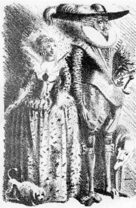
Герцог и герцогиня (Р. Роллан «Кола Брюньон»)

«Иллюстрации Е.Кибрика, несмотря на то, что изображенные на них герои не всегда совпадают с тем, что рисует мое воображение, мне близки и понятны. Ху-