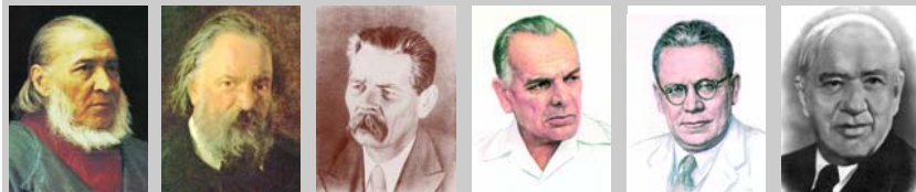
С.Т. Аксаков А.И. Герцен М. Горький К. Паустовский С. Маршак К. Чуковский

Многие из знаменитых людей были обязаны своими успехами произведениям народного творчества, раннему знакомству с лучшими произведениями мировой литературы. Об этом вспоминали С. Т. Аксаков, А. И. Герцен, М. Горький, А. Н. Толстой, К. Паустовский, С. Маршак, К. Чуковский и многие другие.