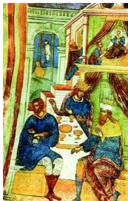
Иосиф Прекрасный в египетском плену

начал я рыдать неутешно. Иосиф, проданный своими братьями, растерзал мое сердце, и я, не могши остановить рыдания моего, оробел, думая, что слезы мои почтены будут знаком моей глупости.