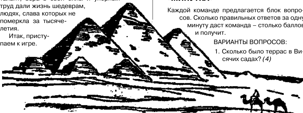
Великие пирамиды — единственное из семи чудес света, сохранившееся до наших дней