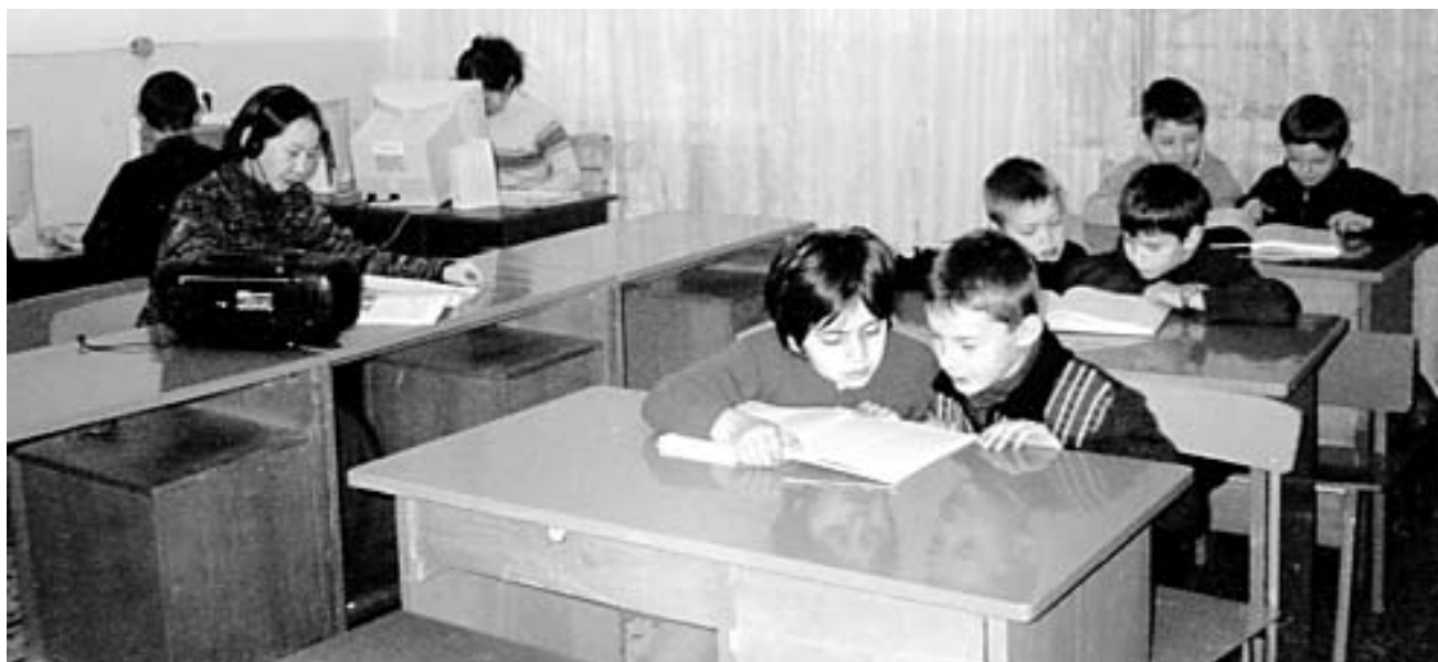
Школа № 1 села Новая Брень. На библиотечном уроке

Когда мы говорим «СЕМЬ ЧУДЕС СВЕТА», то подразумеваем наиболее известные памятники Древнего мира, которые поражали воображение современников настолько, что даже не верилось, что их могли сотворить люди, а не боги. К сожалению, из всех памятников, дошедших до нашего времени, сохранились лишь ЕГИПЕТСКИЕ ПИРАМИДЫ. К другим чудесам относятся: ВИСЯЧИЕ САДЫ В ВАВИЛОНЕ (Сады Семирамиды), ХРАМ БОГИНИ АРТЕМИДЫ В г. ЭФЕСЕ, СТАТУЯ ЗЕВСА, МАВЗОЛЕЙ В ГАЛИКАРНАСЕ, СТАТУЯ ГРЕЧЕСКОГО БОГА СОЛНЦА ГЕЛИОСА (Родосский колосс), АЛЕКСАНДРИЙСКИЙ МАЯК на о. ФАРОС.