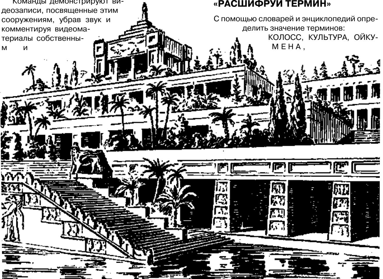
Висячие сады. Ярусы садов поднимались уступами. Великолепные пвльмы и редкостные растения украшали эти сады