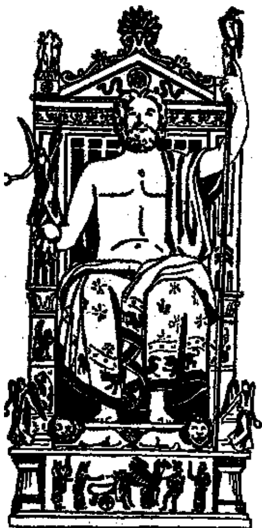
Статуя Зевса Олимпийского работы Фидия.