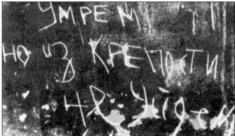
Надпись на стене одного из казематов крепости, сделанная его защитниками