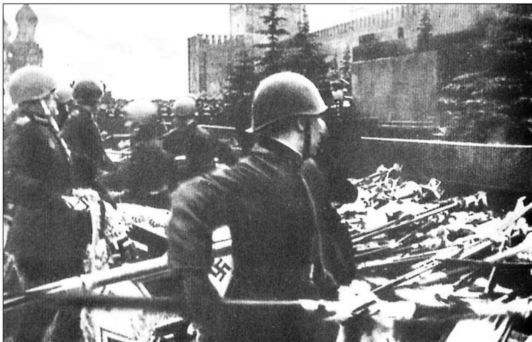
Москва. 24 июня 1945 года. Парад Победы

А тех, кто жив, кто чудом уцелел, Сегодня мы как чудо изучаем.