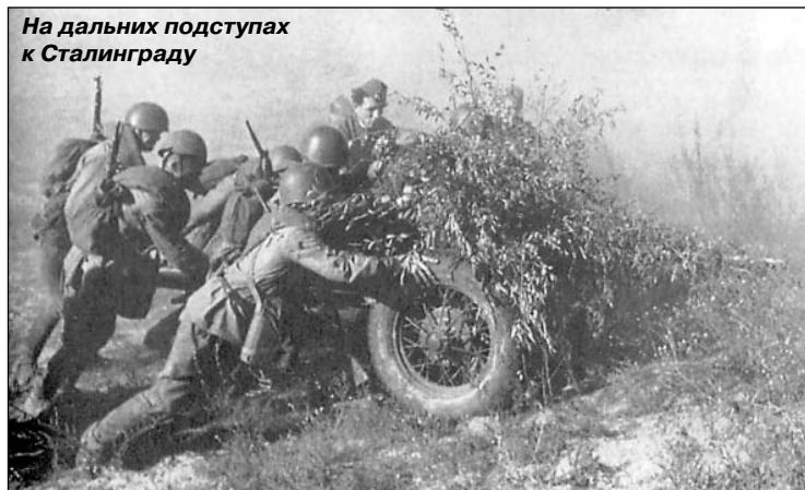
На дальних подступах к Сталинграду