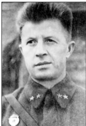
Генерал А.И. Родимцев

сбросили бомбовый груз, не дойдя до цели. Но, увидев, что имеют дело с одним самолетом, они перешли в контратаку. Несмотря на то, что боеприпасы и горючее на исходе, Буданова продолжила бой. Ведущий бомбардировщик группы был сбит. Затем летчица сделала заход на очередную цель и стала сближаться с противником с намерением поразить его таранным ударом. У фашистов не выдержали нервы и они отступили. А советская летчица, раненая, но победившая, посадила свой изрешеченный пулями и снарядами самолет на летное поле, где ее ожидали боевые друзья.