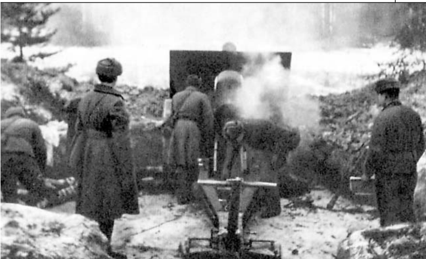
На ближних подступах к Москве

нии в районе деревни Горки Рузского района высокое мужество и отвагу проявили воины-артиллеристы 3-й батареи 694-го истребительно-противотанкового артиллерийского полка. Утром 18 ноября 1941 года наступившие вражеские танки обрушили на батарею шквальный огонь. Вскоре были тяжело ранены комиссар, зам. командира батареи и два командира взвода. На батарее осталось только два орудия, но и танки противника были вынуждены откатиться назад, понеся большие потери.