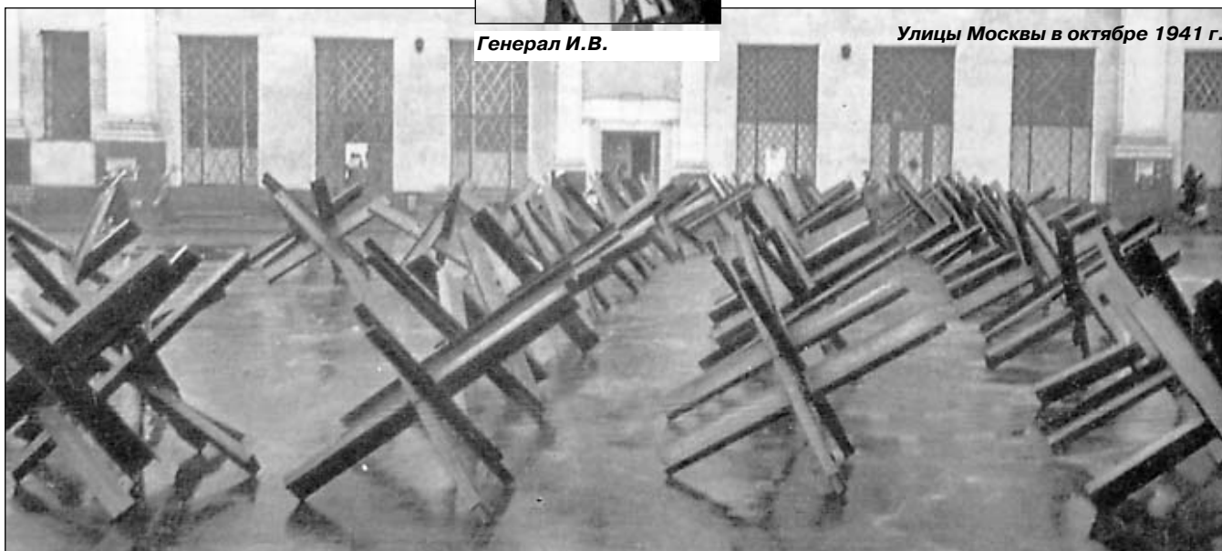
Улицы Москвы в октябре 1941 г.