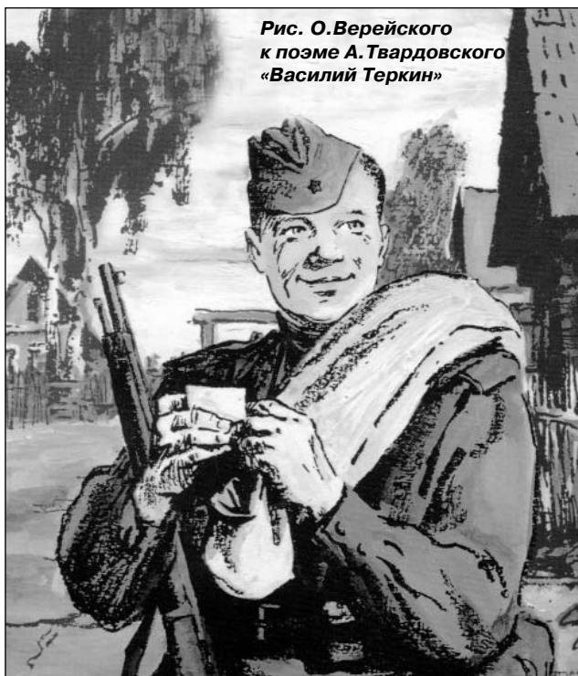
Рис. О.Верейского к поэме А.Твардовского «Василий Теркин»