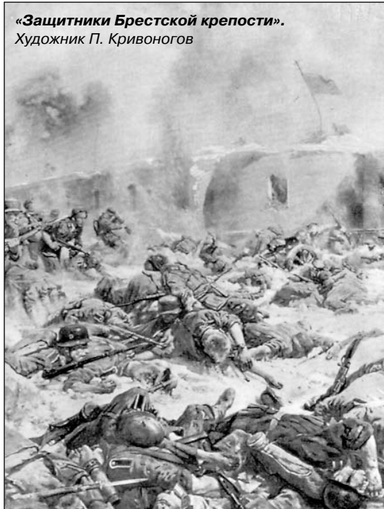
«Защитники Брестской крепости». Художник П. Кривоногов