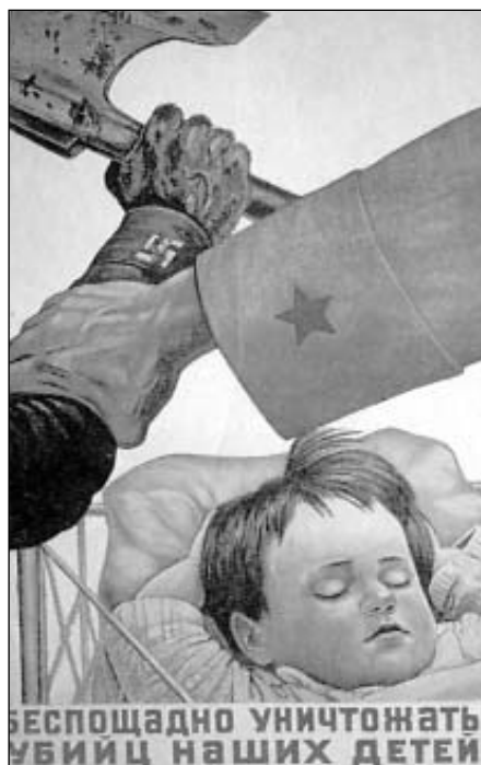
В.Аверин. Плакат 1941 г.