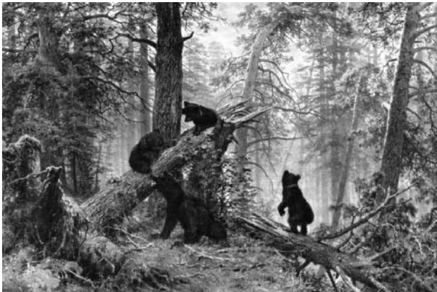
И.И. Шишкин. Утро в сосновом лесу

исследователи подчеркивали три: силу эмоционального воздействия экранизации как произведения аудиовизуального искусства; непосредственность связи фильма и литературного первоисточника (каждый из них своими средствами выражает общую для обоих фабулу); сравнительную легкость поисков источника — это часто одноименная с фильмом, широко известная книга.