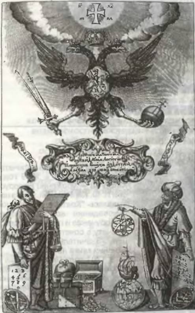
Страницы "Арифметики" Л. Магницкого. 1703 г.

сии. Книгу можно было встретить в самых отдаленных уголках страны. Один из экземпляров попал в руки М. В. Ломоносова, который позже назвал "Арифметику" Л. Магницкого и "Грамматику" М. Смотрицкого "вратами своей учености".