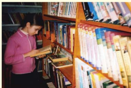
У стеллажа со справочной литературой