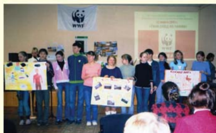
Открытие экологической акции «Твой след на Земле» 22 марта 2007 г.

г. Пскова совместно проводят Неделю детской книги и заключительный праздник. В 2008 году, например, во время проведения праздника дети смогли встретиться с писателем Тamarой Крюковой , взять у нее автограф, купить понравившиеся книги автора, ознакомиться с выставкой творческих работ по прочитанным книгам, посмотреть концерт детского хореографического ансамбля.