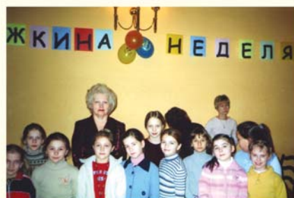
Ежегодное проведение «Недели детской книги»