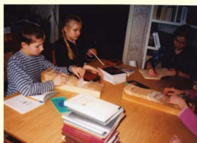
На смену приходит другое поколение помощников библиотеки.