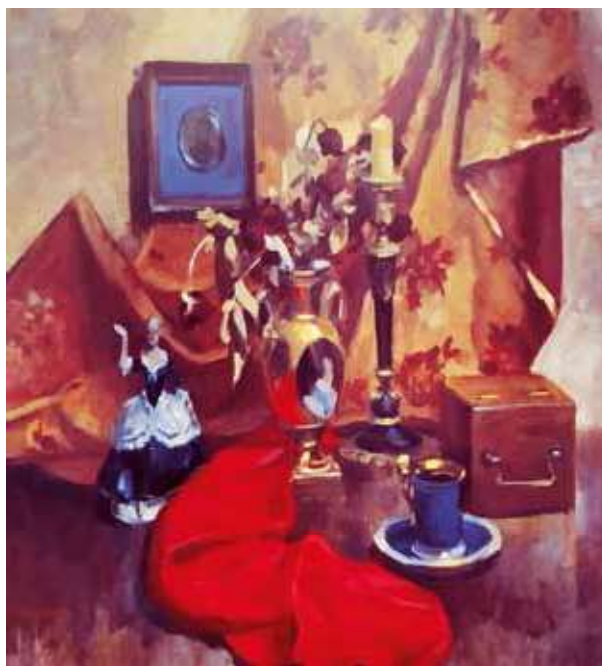
Рис. 4. Владимир Панов. Натюрморт

— Верно подметил! Об этой особой ауре в иллюстрациях Панова много написано в различных статьях и публикациях. Такое ощущение у многих складывается. И в этом — большое достоинство произведений художника.