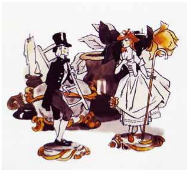
Рис. 5. Владимир Панов. Иллюстрация к сказке Х.К. Андерсена «Пастушка и трубочист»

Я помню, Владимир Петрович очень серьёзно относился к историческим костюмам и предметам прошлых эпох. Он часто говорил: