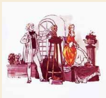
Иллюстрации Владимира Панова

— Правильно заметил, дорогой друг, — согласился я. Но это кажущаяся лёгкость. Чтобы её добиться, художнику надо было много поработать. Возможно, сделать не один вариант картинки.