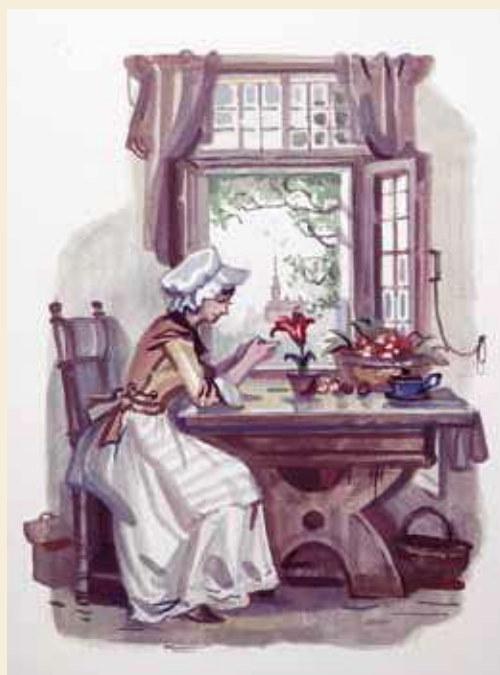
Рис 2. Дмитрий Поляков. «В ту же минуту в сердцевине цветка что-то щёлкнуло, и он раскрылся. Это был в самом деле большой тюльпан, но в чашечке его сидела живая девочка»

ней: Чехов, Тургенев, Лермонтов. Из зарубежных — Х.К. Андерсен, его любимый.