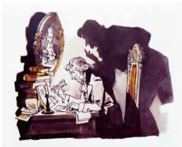
Рис. 3. Владимир Панов. Иллюстрация к сказке Х.К. Андерсена «Тень»

— Иллюстрация очень интересная, — опередил меня Читайка. — Такая живая, лёгкая. Кажется, что сделана она на одном дыхании.